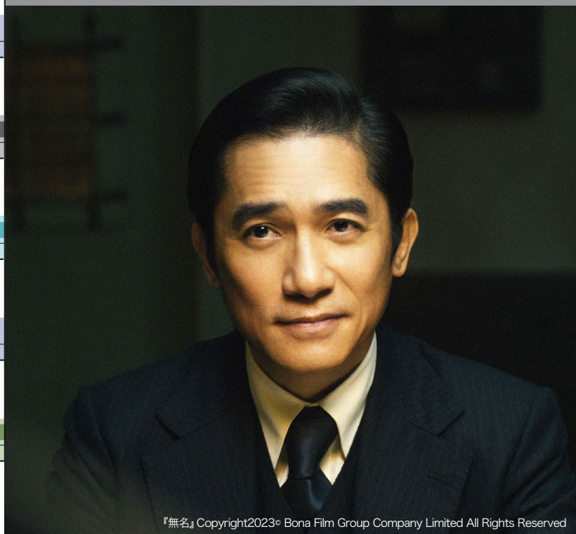
『無名』 Copyright2023© Bona Film Group Company Limited All Rights Reserved

舞台挨拶・トークイベント ※イベント日時・ゲストは、諸事情により変更になる場合がございます。 ★『映画 ○月○日、区長になる女。』【舞台挨拶】4.28(日)14:25回上映後、ペヤンマキ監督 ★『すべて、至るところにある』【舞台挨拶・トークイベント】4.27(土) - 5.2(木)18:50回、5.4(土)、5(日)、10(金)16:25回上映後、リム・カーワイ監督ほか、詳細は劇場HPをご確認ください。 ★『どこでもない、どこしかない』【舞台挨拶】4.27(土)、29(月)、5.1(水)21:00回上映後、リム・カーワイ監督 ★『いつか、どこかで』【舞台挨拶】4.28(日)、30(火)、5.2(木)21:00回上映後、リム・カーワイ監督 ★『あずきと雨』【舞台挨拶・トークイベント】5.18(土)、19(日)、22(水)、24(金)16:40回上映後、隈元博樹監督ほか ★『走れない人の走り方』【舞台挨拶】5.18(土)、19(日)、20(月)18:25回上映後、蘇籐淳監督